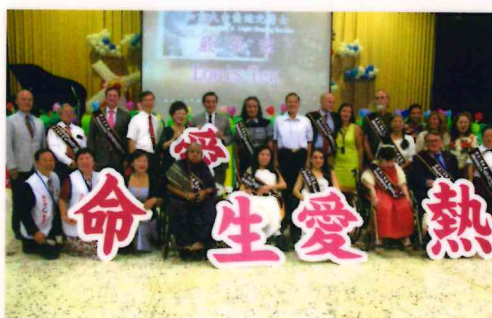
2018年全球熱愛生命獎章得主會師活動。