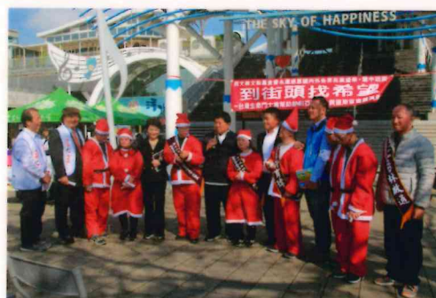
到街頭找希望—台灣生命鬥士為幫助敘利亞難童、貝里斯盲童義演傳愛（台中清水服務區）。