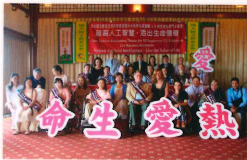
周大觀文教基金會非常感恩國內外各界共襄盛舉，以及向全球生命鬥士敬禮。