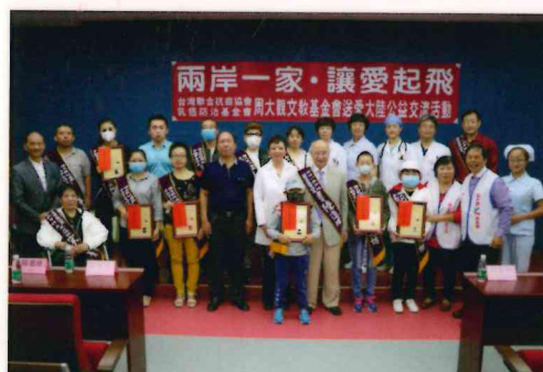
兩岸一家·讓愛起飛—周大觀文教基金會送愛大陸公益交流活動。