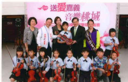
送愛嘉義—捐贈二手樂器再奏希望樂章。