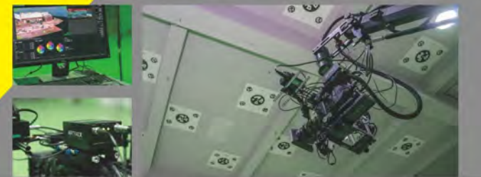
• 光學追蹤系統、電影高速攝影機、電動遙控機器手臂系統