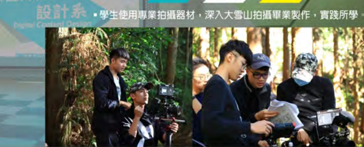
• 學生使用專業攝影器材，深入大雪山拍攝畢業製作，實踐所學。